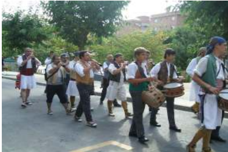
CERCAVILA, MATARÓ 14 JULIOL 2007