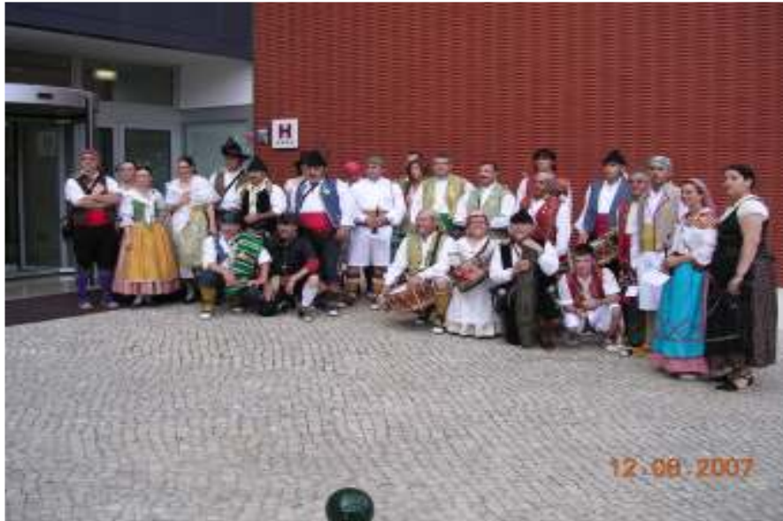
MUSICS I TRABUCAIRES

La delegació espanyola i la brasilera formen part del programa “ Festas Em Transito ”, en el que Castelló participa gràcies a la Fundació Blasco d'Alagón, artífex d'aquest intercanvi cultural, i al que la Colla agraeix les atencions rebudes. Van desfilars l'Esquadra de Trabucaires de la Colla Xaloc, la Colla de Dolçainers i Tabaleters Xaloc magníficament reforçada amb músics de les Colles “Xarànçaina de Castelló, de Nules, Vila-real i Benicarló, als que agraiem no sols el suport rebut, sinó també la seua qualitat humana. També va desfilars el Grup de Ball “Grup Castelló”.