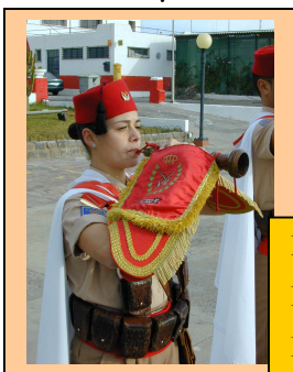
DOLÇAINERA DE LA "NUBA" DE REGULARS

Aquests instruments populars, llavors fabricats a mà, de difícil afinació i per això tècnicament considerats de rang inferior a la resta, en desaparèixer, es van substituir per les gaites (semblants al model asturià) amb un sol roncó, i que eren reglamentàries a la resta de l'Exèrcit Espanyol fins i tot a les Unitats de la Península, tenint aquestes gaites més facilitat d'adquisició, reposició de peces, afinació i que donaven un resultat de so semblant, així com "tabals" (tambors), amenitzant així durant almenys trenta anys.