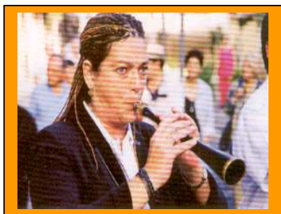
LA GRALLA CATALANA

"chirimía") i "xa-" i més tard "xe-" en valencià ("xeremia" o "xeremita"). La part final de la paraula:..."-mella", va canviar a "-mia" o "-mie". En francès va evolucionar a "chalamie".