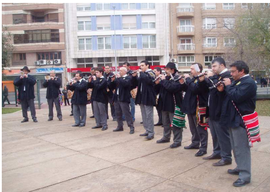
La Colla Xaloc participant en la Trobada