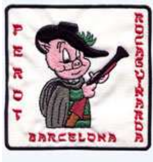
LOGOTIP DE LA COLLA PEROT ROCAGUINARDA