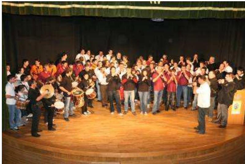
DOLÇAINERS I TABALETERS DE TOTS ELS GRUPS PARTICIPANTS INTERPRETANT UNA PEÇA CONJUNTA

Èxit de la “II Trobada de Colles de Dolçaina i Tabal a l'Alcora”.