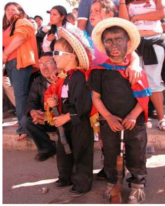
ELS XIQUETS COM A TOTS ELLS LLOCS, FUTUR DE LA FESTA