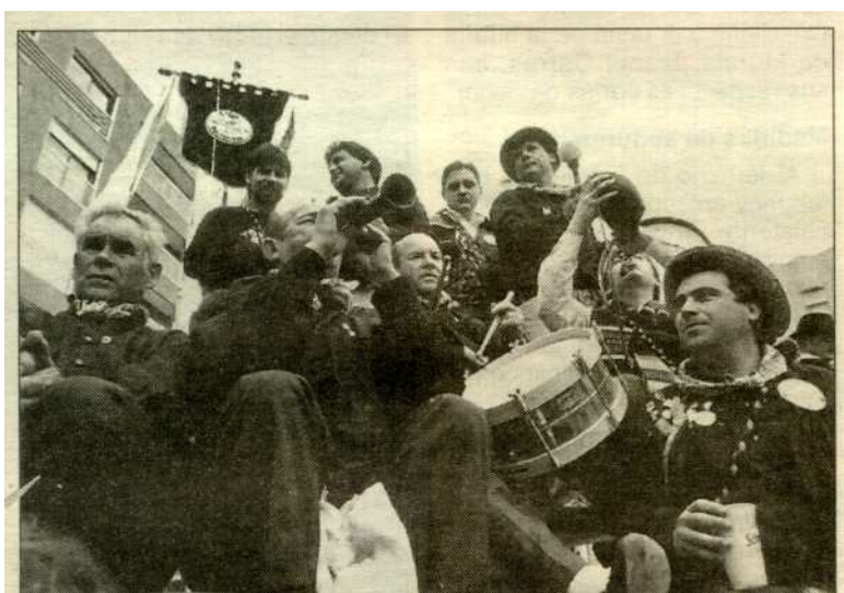
Las «colles» disfrutaron con la cabalgata.

La família Boronat van participar al primer Aplec de Dolçainers i Tabaleters de Castelló l'any 1993, y van ser convidadats al cadafal de la colla Polseguera com podeu vore en la foto de baix, resultant una data aquella per a recordar. Cal dir que Tres dolçainers components de la colla Xaloc, pertanyen també a la colla Polseguera, grup fester d'ací de Castelló.