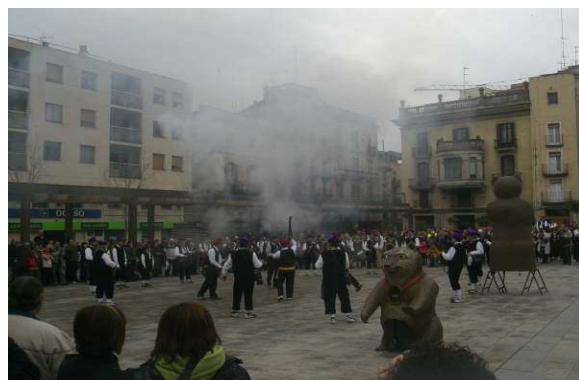
IMATGES DE LA TROBADA