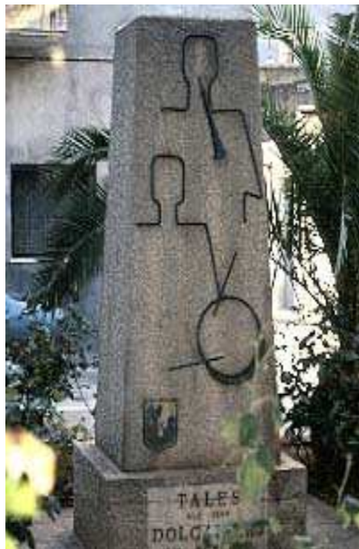
MONUMENT ALS DOLÇAINERS DE TALES (PLANA BAIXA)