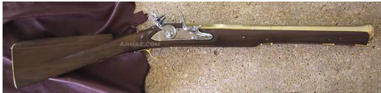
TROMBLON (FRANCIA) www.armae.com