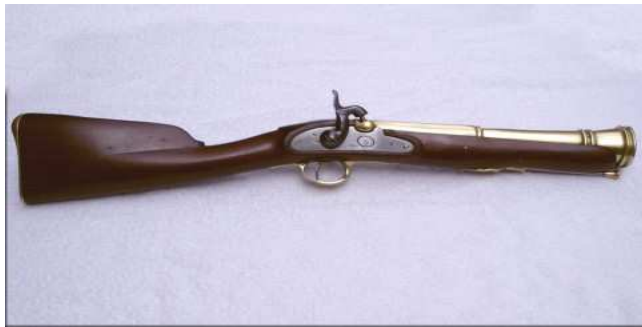
TRABUCO NARANJERO (ARGENTINA) www.osvaldogatto.com.ar

Ací us mostrem les fotos per a que gaudiu i, si voleu més informació cal pegar un colp d'ull a les pàgines web.