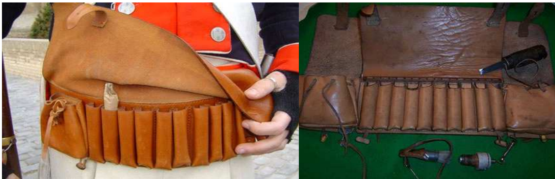
MODELS DE CANANES VENTRALS

Lluny està el sistema que s'utilitzava fa ara 200 anys en èpoques de la Guerra del Francès, en què les tropes regulars, atenent a la uniformitat, utilitzaven cartutxeres penjades a un costat o cap arrere per corretjams més o menys voluminosos que creuaven el cos en diagonal. Els guerrillers i cossos de milícies utilitzaven cananes ventrals col·locades damunt de la faixa, per a portar unes dotzenes de cartutxos, perquè els resultava més pràctica i ràpida la càrrega, aquesta curiositat està arreplegada en nombrosos testimonis i memòries escrites de soldats francesos.