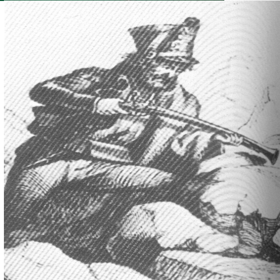
DETALL DE CARTUX