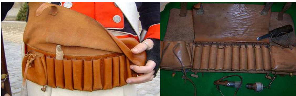
MODELS DE CANANES VENTRALS

Lluny està el sistema que s'utilitzava fa ara 200 anys en èpoques de la Guerra del Francès, en què les tropes regulars, atenent a la uniformitat, utilitzaven cartutxeres penjades a un costat o cap arrere per corretjams més o menys voluminosos que creuaven el cos en diagonal. Els guerrillers i cossos de milícies utilitzaven cananes ventrals col·locades damunt de la faixa, per a portar unes dotzenes de cartutxos, perquè els resultava més pràctica i ràpida la càrrega, aquesta curiositat està aplegada en nombrosos testimonis i memòries escrites de soldats francesos.