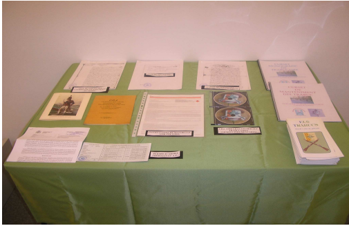
DOCUMENTS DEL ARXIU DE L'ESQUADRA