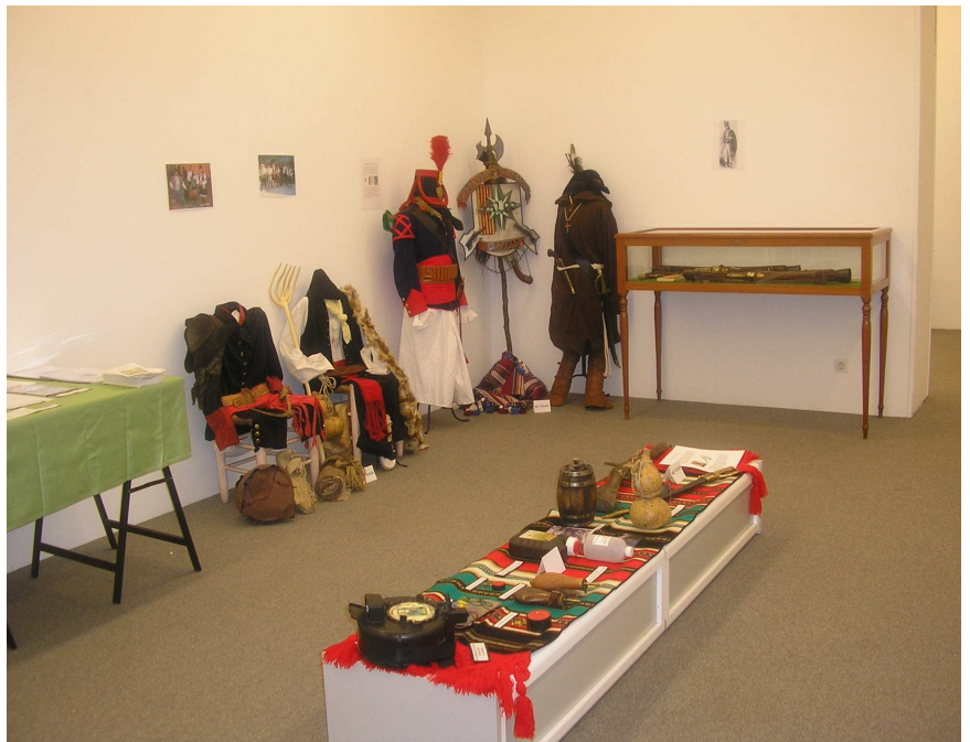
EXPOSICIÓ DE MATERIALS DE L'ESQUADRA DE TRABUCAIRES XALOC

L'Esquadra de Trabucaires Xaloc va estar present en les X Jornades de cultura popular a Castelló. En aquesta edició de 2007 es van tractar les diverses facetes del foc com són el símbol, element històric, mític, cultural o lúdic, per la qual cosa aquestes jornades han mostrat la riquesa etnològica de la província de Castelló. L'Esquadra va participar en l'exposició del foc, en la que va mostrar elements de la indumentària i equip dels guerrillers i voluntaris castellonencs en la Guerra del Francès (1808-1814) que representem, trabucs antics i actuals, pistoles d'avantcàrrega, polvoreres i envasos de pólvora, pistons, sabres de l'època, elements de seguretat, documents, llibres, còpies dels fulls de servei d'alguns guerrillers, cursets i altres articles que habitualment utilitzem.