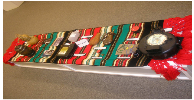
ELEMENTS VARIATS EMPRATS PELS TRABUCAIRES