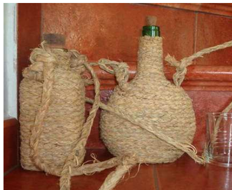
RECIPIENTS DE VIDRE ENCORDADTS

També s'utilitzaven botes de pell i tonellets per a contindre vi, eren recipients de grandària reduïda (normalment no més de 2 litres), També s'utilitzaven recipients de ceràmica, encara que aquest darrer cas, més que a nivell individual, es transportava en carruatges o cavalleries com a part del bagatge de les partides.